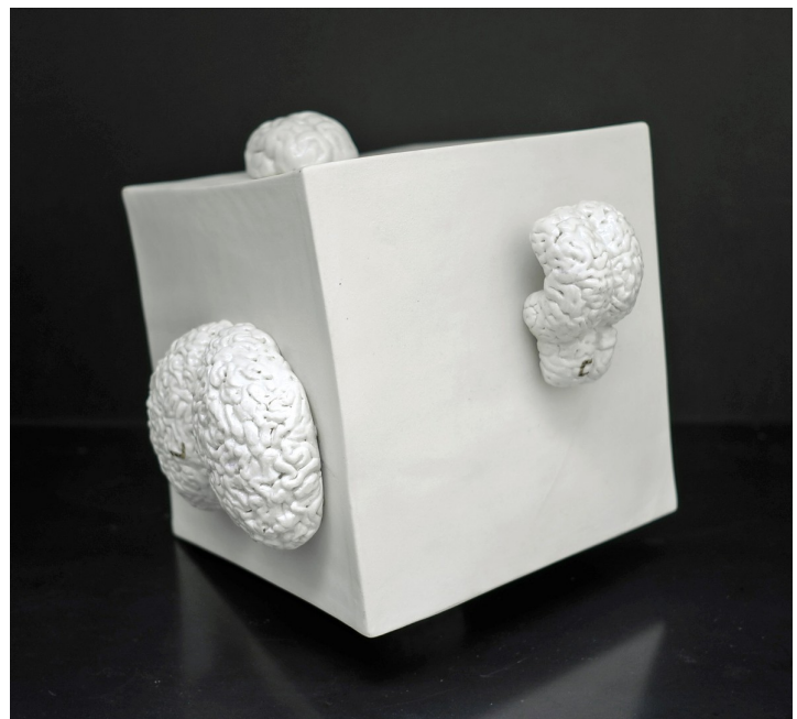
Brain's cube. Porcelaine partiellement émaillée, lustre or 27·26·24 cm ( haut ) Figure animal. Grès émaillé 15·14·16 cm ( bas )