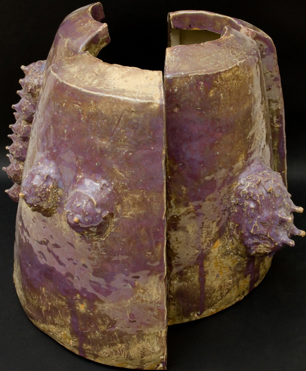
Feeding matrix. Grès émaillé 38·38·34 cm