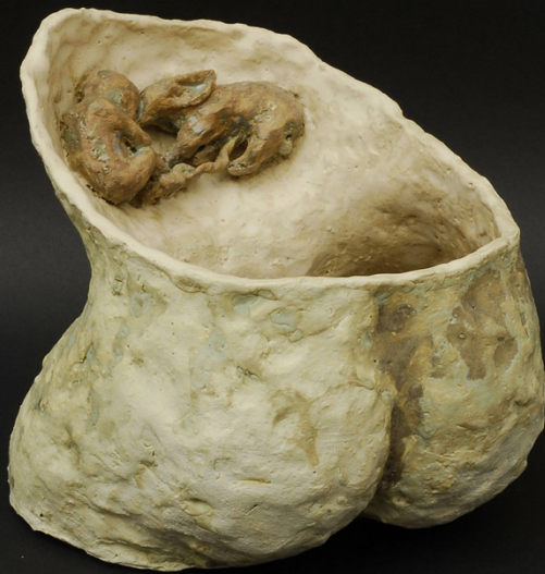
Woman with little sow. Grès émaillé, 11·8·6 cm ( haut ) Twins. Grès émaillé, 22·21·18 cm ( bas )