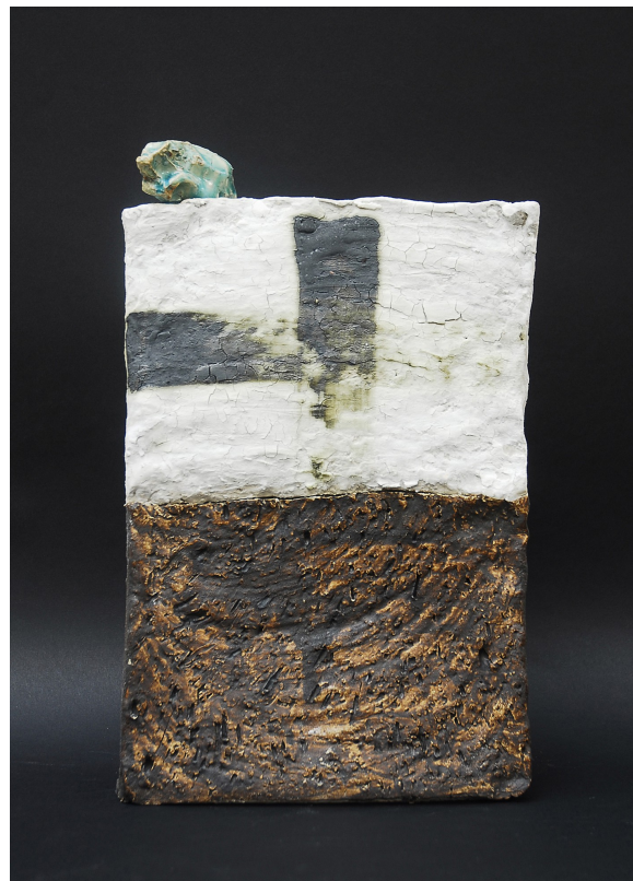
Crosswall. Grès émaillé et oxydes 36·21·8 cm ( droite ) Entourer 10. Grès émaillé 57·61·32 cm ( bas )